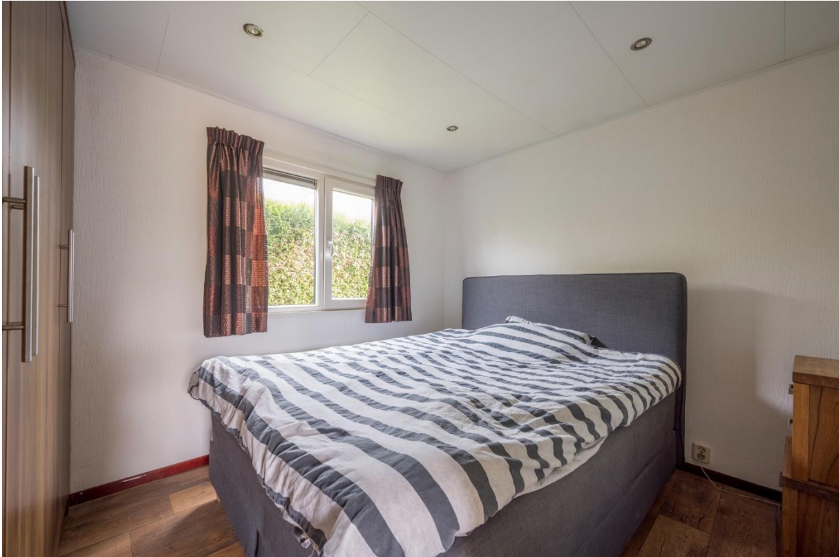
Slaapkamer 1 met vaste kastenwand