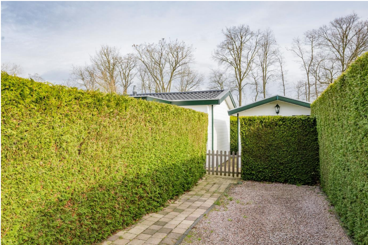
Parkeergelegenheid op eigen terrein